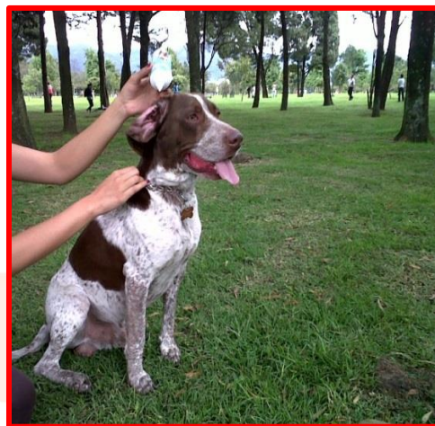
Grafica N°8 Instilando Brillo Otic dentro de oreja

Coloque la punta de la boquilla en la parte superior del conducto auditivo externo; Aplique BRILLO® OTIC en el canal auditivo de 5 a 15 gotas, realice un suave masaje en la base de la oreja, deje actuar por 1 a 5 minutos, y limpie el interior con algodón o gasa humedecida con BRILLO® OTIC .