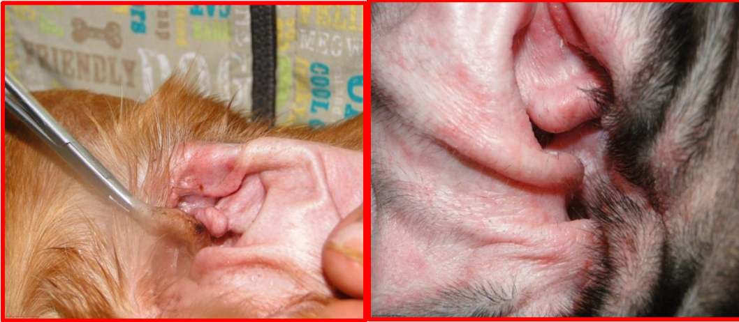
Grafica N°10 Limpiando con algodón